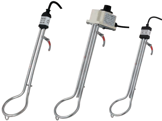
スタンダードタイプ